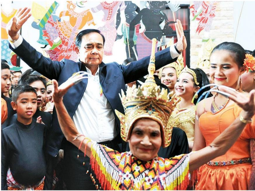
☞ มนิราห์ - พล.อ.ประยุทธ์ จันทร์โอชา ชมการแสดงศิลปกรรมร่วมสมัยนานาชาติ 2018 และรำยรำมนิราห์กับนักแสดง ที่ศูนย์การเรียนรู้วิถีวัฒนธรรมอินดามัน อ.เมือง จ.กระบี่ เมื่อวันที่ 21 ก.พ.

มอบหนังสือโครงการปาฐกถาบ้านธารน้ำร้อน และมอบหนังสืออนุญาติให้เข้าทำประโยชน์ภายในเขตปฏิรูปที่ดิน (ส.ป.ก.4-01) ให้ผู้ตัวแทนเกษตรกร