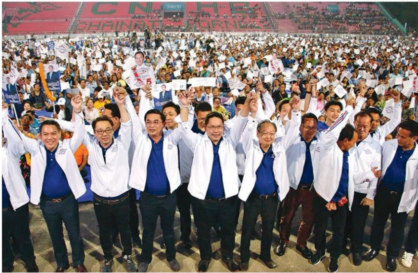
🏠 ยึดชัยนาท - นายอุดม สวณายน หัวหน้าพรรคพลังประชารัฐ นายสนธิรัตน์ สนธิจิรวงศ์ เลขานุการพรรค พร้อมด้วยแกนนำ เปิดปราศรัยใหญ่ครั้งแรกในภาคกลาง ที่เขาพลอง สเตเดียม จ.ชัยนาท เมื่อวันที่ 21 ก.พ.

นั่น อย่าลืมถ้าทำให้เขาเสียขวัญ ไม่มีกำลังใจ วันหน้าใครจะมารบให้กับเรา หากกระสุนปืนใหญ่ ปืนเล็กตกมาแล้วใครจะไป