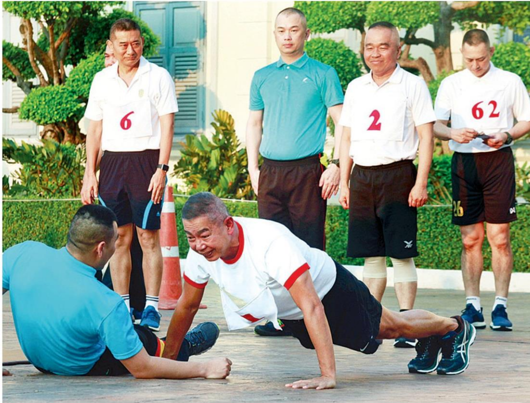
🏠 สตรีรอง - พล.อ.อภิรัชต์ คงสมพงษ์ ผบ.ทบ. นำผู้บังคับบัญชาระดับสูงทดสอบสภาพร่างกายประจำปี ภายใต้นโยบาย 'สมาร์ท ซิลิเยอร์ สตรีรอง อารมี' ที่บ.ท.บ. เมื่อวันที่ 21 ก.พ.

หัวข้อข่าว: ตู๋ครวญ-โดนแข่งให้ปั่นตกหลังซี-130ไบพัดพัง